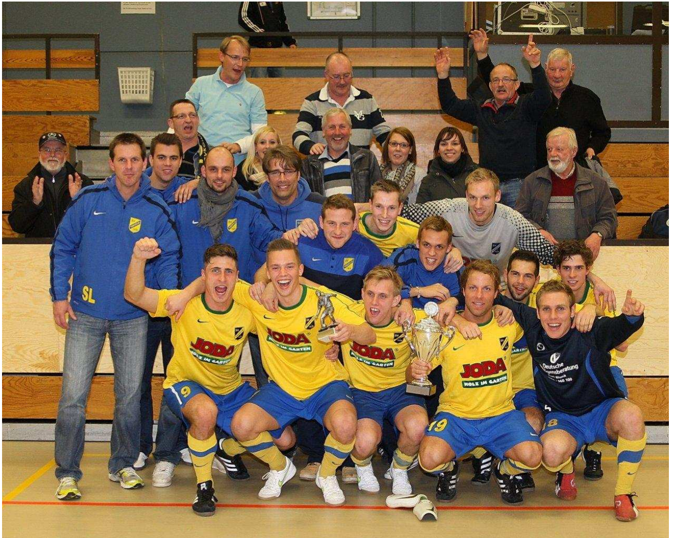
Hallenkreismeister 2011 SV Todesfelde

Im Halbfinale hatte der SVT den Verbandsligisten TuS Hartenholm mit 2:1 bezwungen, der SV Weede konnte sensationell den SH-Ligisten SV Henstedt-Ulzburg mit 7:5 n.E. (2:2) besiegen. Schon in der Vorrundengruppe hatten die Weeder mit dem SV Schackendorf einen weiteren SH-Ligisten aus dem Turnier geworfen.